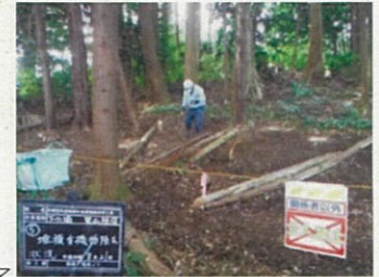
例：残渣除去の様子